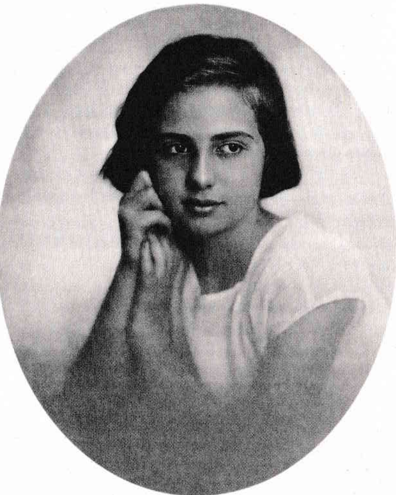
Clody la 12 ani